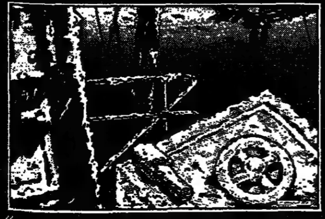
« Dans l'été, le Titanic repose par 4000 mètres de fond quelque part au large de Terre-Neuve. Le 15 août, une équipe franco-américaine entreprend la tentative des câbles dont les secrets devraient être divulgués en août. »

En exclusivité EUROPE 1 couvre l'événement. Tous les jours notre envoyée spéciale, Brigitte RENALDI vous donne rendez-vous à l'antenne dans les journaux d'EUROPE 1: 7h25-9h - EUROPE MIDI - DECOUVERTES